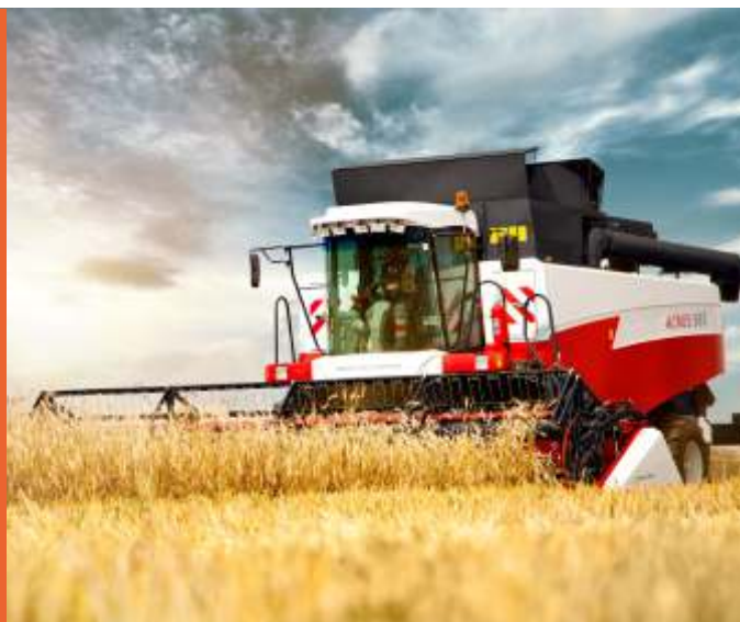
Электрифицированный стенд «КОМБАЙН ACROS»

Учебный тренажер предназначен для специализированных учреждений, осуществляющих подготовку водителей спецтехники, в том числе самоходных зерноуборочных машин (комбайнов). Также его использование возможно при преподавании автодела в учреждениях общего и среднего профессионального образования (сельскохозяйственных колледжах, лицеях).