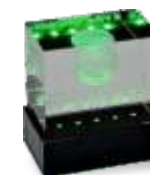
Республиканский молодежный форум