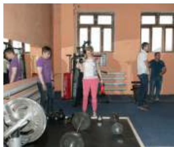
Открытие тренажерного зала