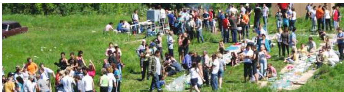
Корпоративный выезд на природу