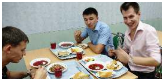
Открытие столовой для сотрудников предприятия