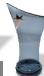
За яркий дебют на форуме «Создай себя сам»