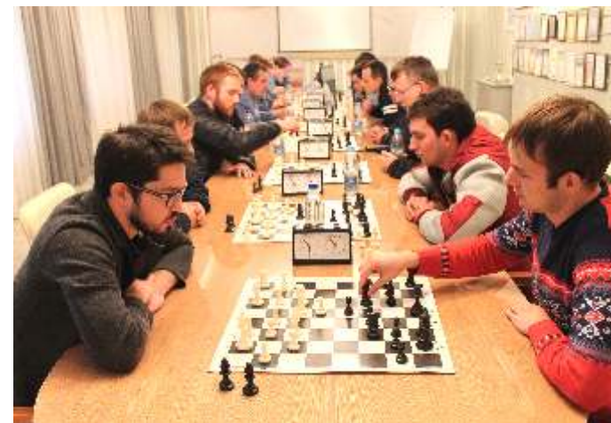
Турнир по шахматам среди сотрудников ПО «Зарница»