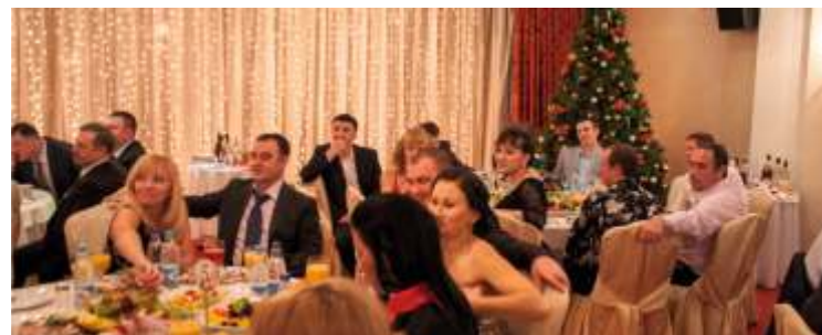
Общекорпоративное празднование Нового года