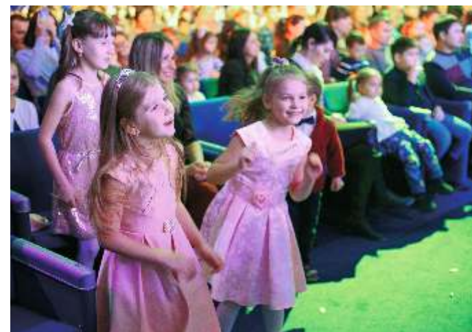
Новогодний праздник для детей сотрудников компании