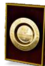
Лучший поставщик технических средств обучения