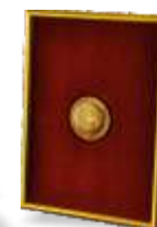
Гарантия качества и безопасности