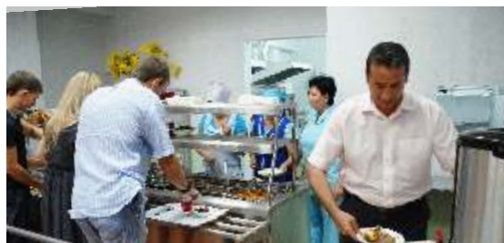
Открытие столовой для сотрудников предприятия