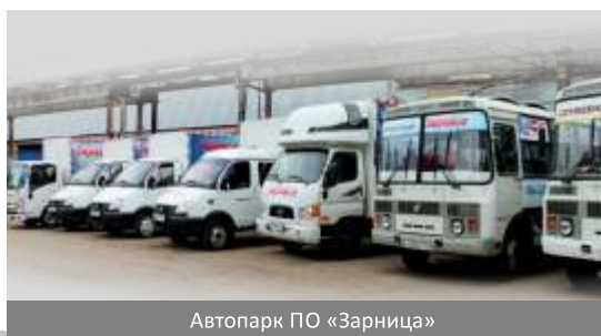
Автопарк ПО «Зарница»