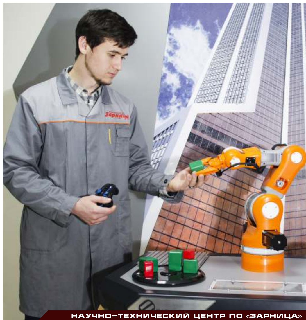
НАУЧНО-ТЕХНИЧЕСКИЙ ЦЕНТР ПО «ЗАРНИЦА»