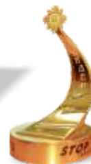
Лучший поставщик технических средств и оборудования для обучения ПДД